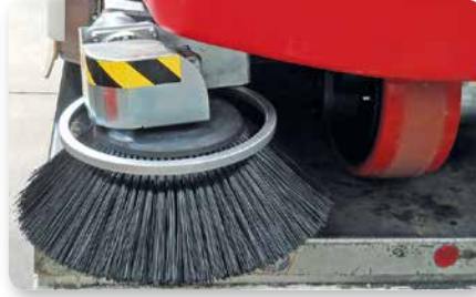
Spazzole laterali destra e sinistra Left and right side brushes Cepillos laterales, izquierda y derecha