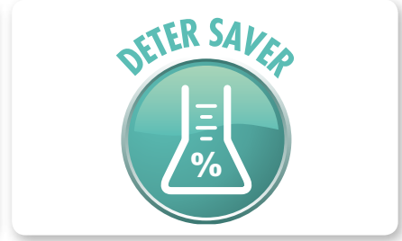
Sistema dosaggio detergente Detergent dosing system Sistema dosificación detergente