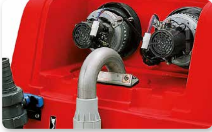
Doppio motore aspirazione Twin vacuum motors Doble motor de aspiración