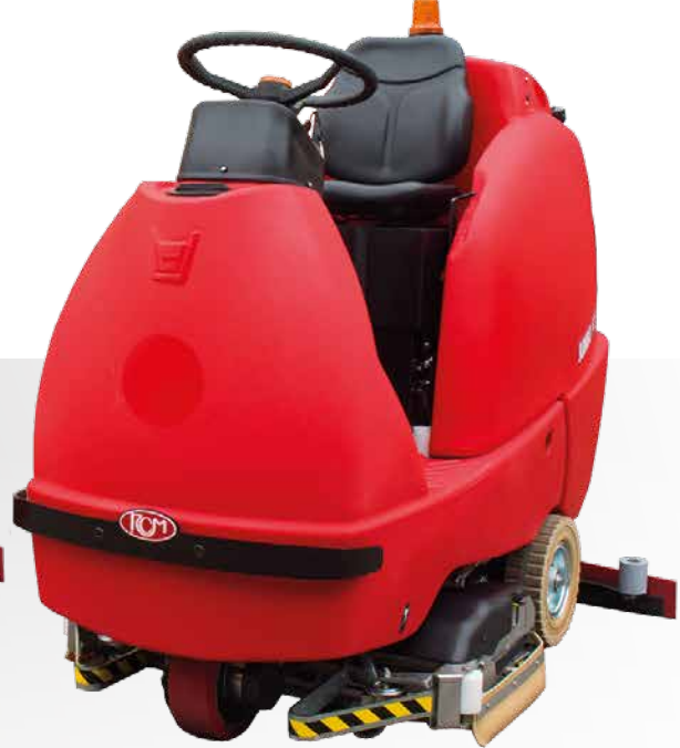
JUMBO lavante-spazzante scrubbing-sweeping fregadora-barredora