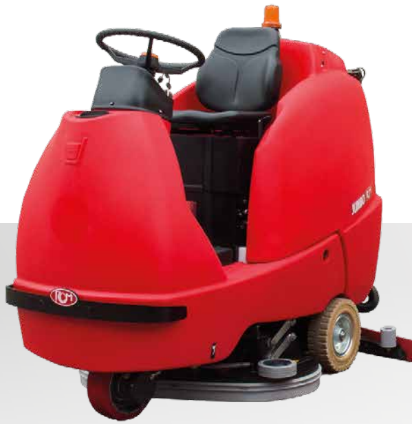
JUMBO lavante scrubbing fregadora