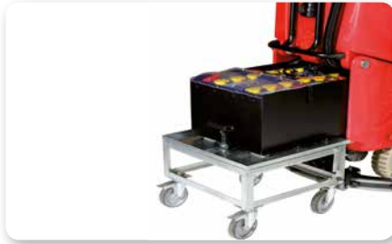
4 Batterie 6V-270 Ah(20h) con cambio rapido Quick-change 4x6V-270 Ah(20h) batteries 4 Baterías 6V-270 Ah(20h) con cambio rápido