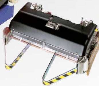
ELAN lavante-spazzante scrubbing-sweeping fregadora-barredora

BASE WITH DISC BRUSHES OR ROLLER BASES CON CEPILLOS DE DISCO Y DE RODILLO