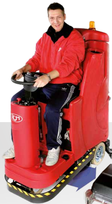
ELAN lavante scrubbing fregadora