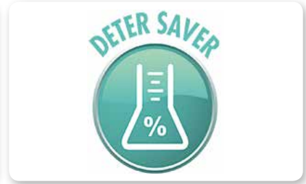
Dosatore detergente on board On board detergent dosing system Dosificación detergente a bordo