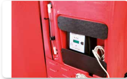
Scuotitore elettrico On-board battery charger Cargador de batería incorporado