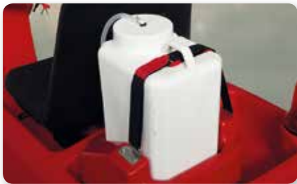
Dosatore detergente on board On board detergent dosing system Dosificación detergente a bordo