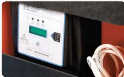
Carica batterie on board On-board battery charging Cargador de batería incorporado