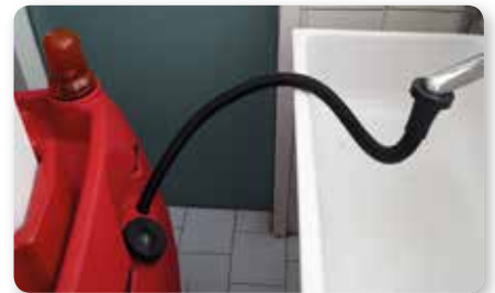
Tubo riempimento serbatoio Solutions filling hose Manguera llenado deposito